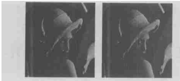
(a) 本文算法 (b) PCRD 优化算法